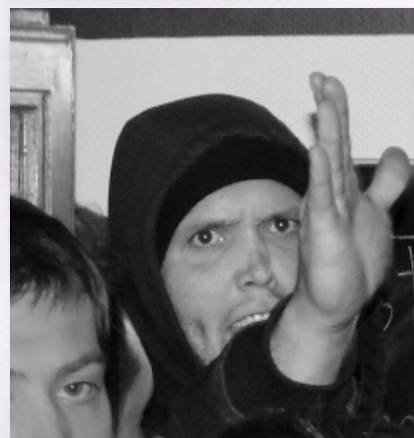
Veranstaltungsgegner am Eingang zum Club Voltaire

gang der engen 'Kleinen Hochstraße' und am Zugang zum Club-Lokal. Ob dieser Aufmarsch ordnungsbehördlich überhaupt angemeldet war, ist nicht bekannt. Polizei war zunächst keine vor Ort, wurde aber zu Hilfe gerufen, als die Meute während der Veranstaltung, an der auch Behinderte im Rollstuhl teilnahmen, bedrohlich gegen die Schaufensterscheibe des Club Voltaire einhämmerte. Die Kasse wurde geraubt und ein weibliches Club-Vorstandsmitglied wurde dabei körperlich angegriffen. Jemand, der sich den Eindringlingen entgegengestellt hatte, berichtete am nächsten Tag, dass er gewürgt worden sei und er immer noch Schmerzen habe.